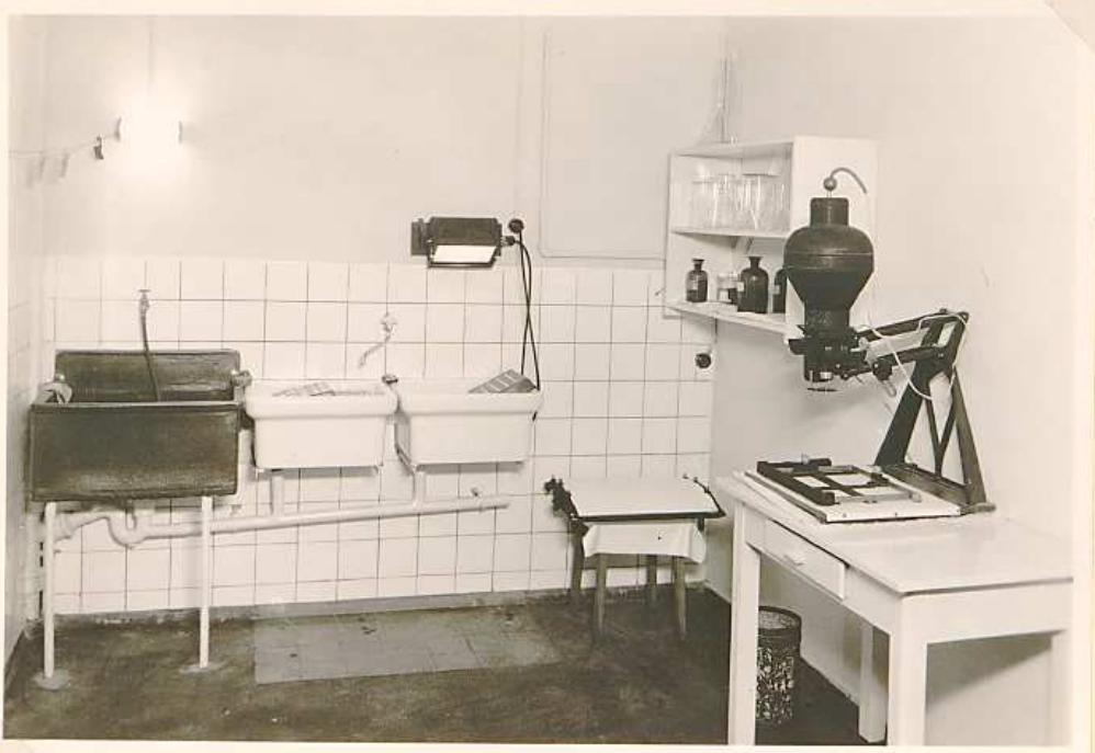
Fotolabor 1. Stock (jetzt 16m. Zi.) 1910