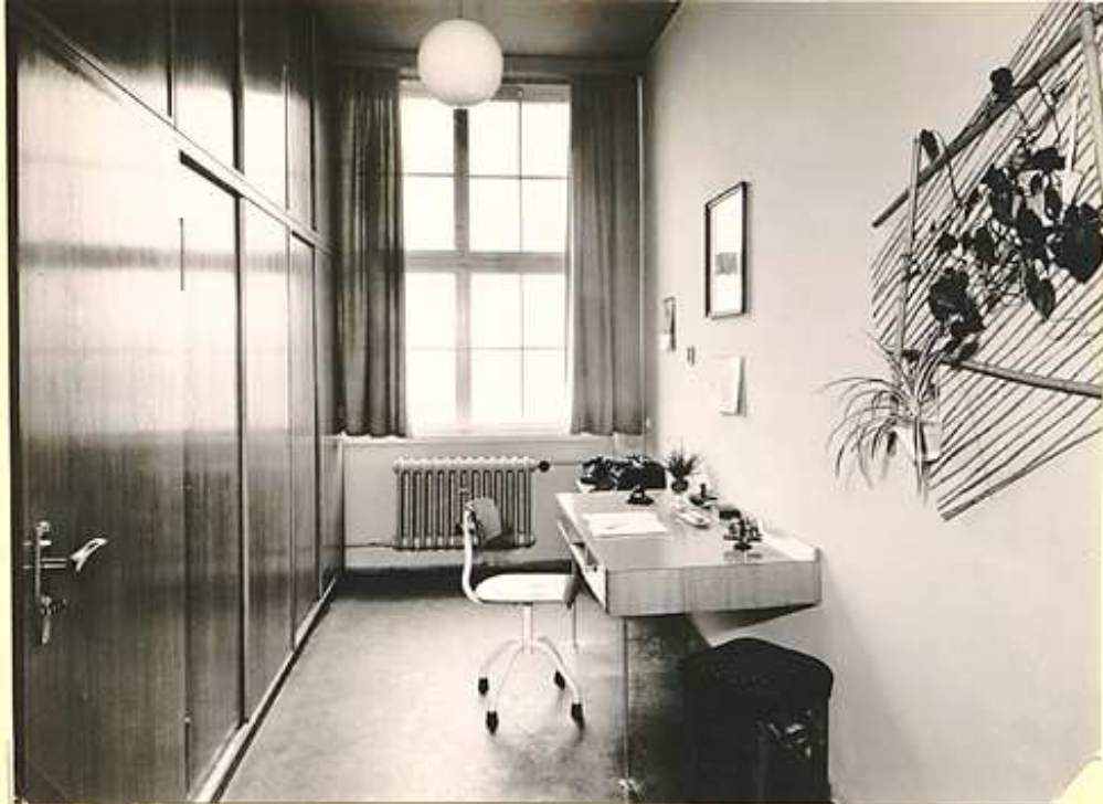
Chief - Secretariat made Mumbai 1960