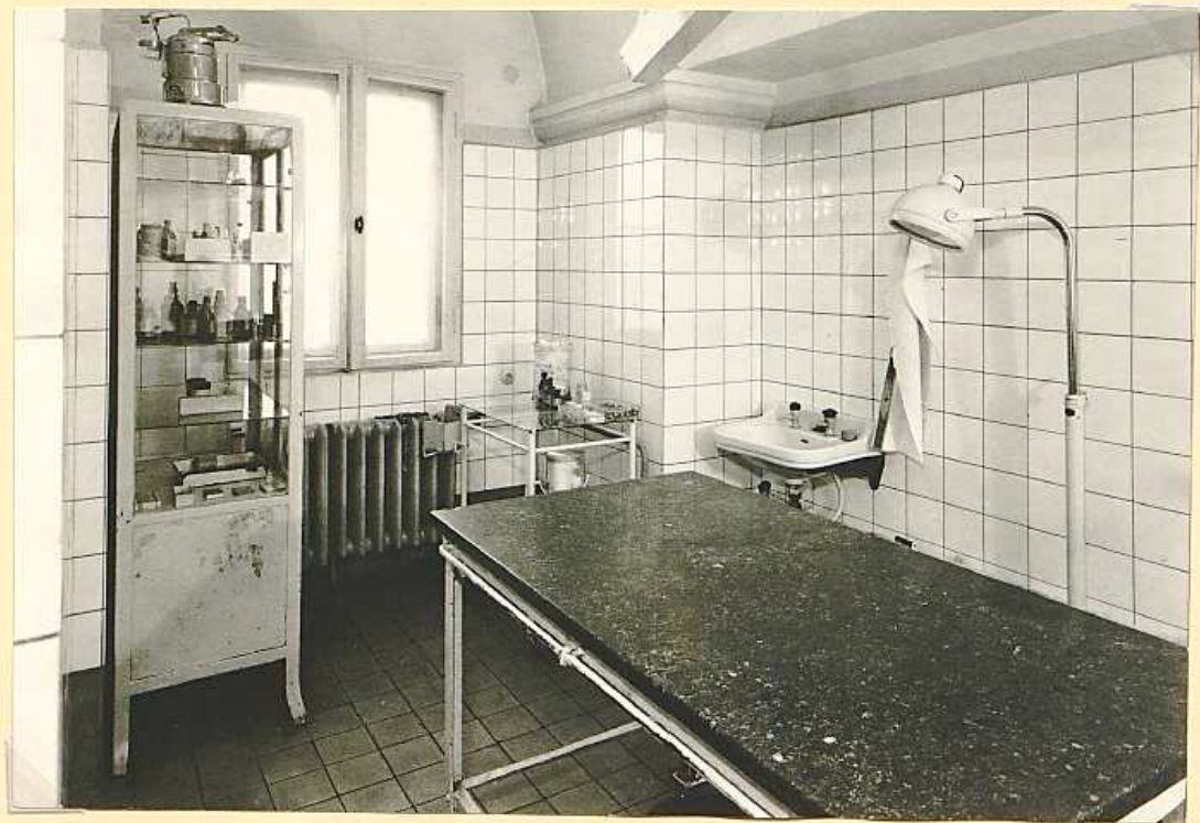
Infektionsabt. nach Umbau