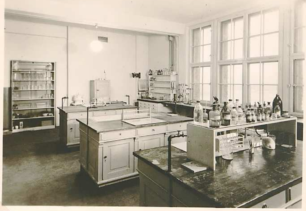
Rabor Bio 1959