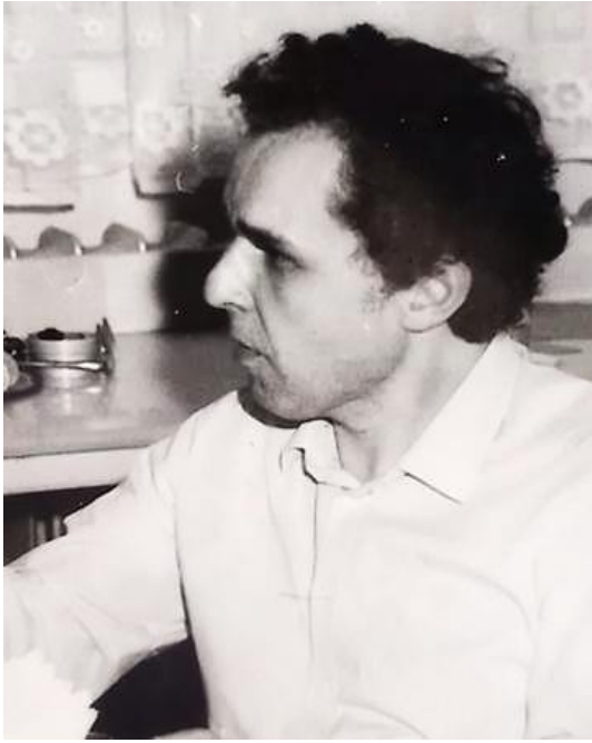
G. Kunz, Pathologie