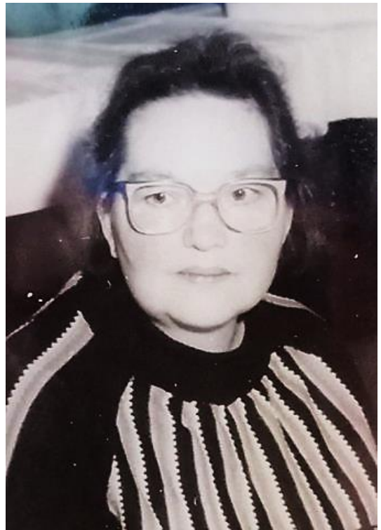
A. Jahr, Pathologie