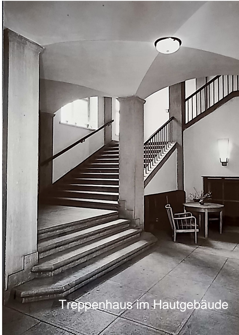
Treppenhaus im Hautgebäude