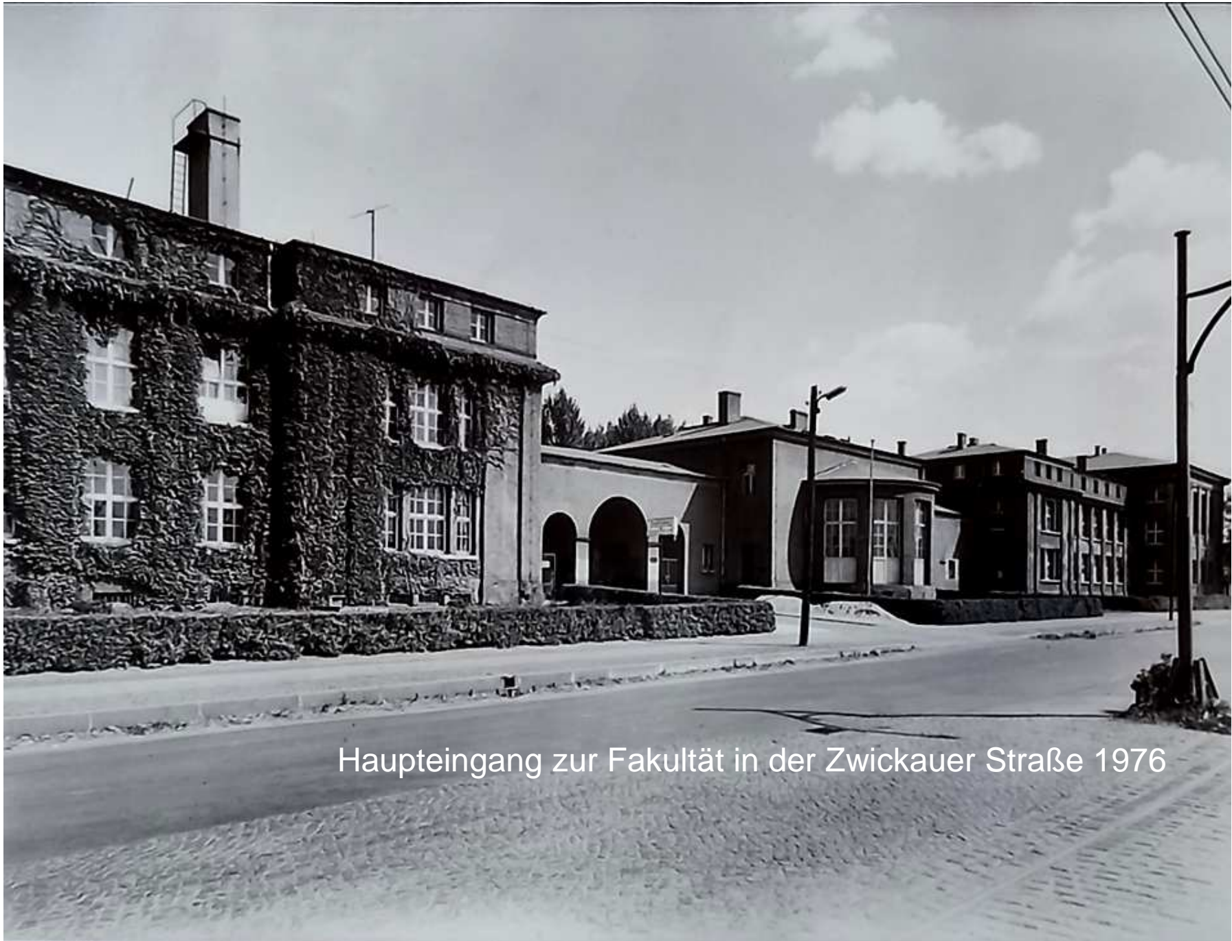
Haupteingang zur Fakultät in der Zwickauer Straße 1976