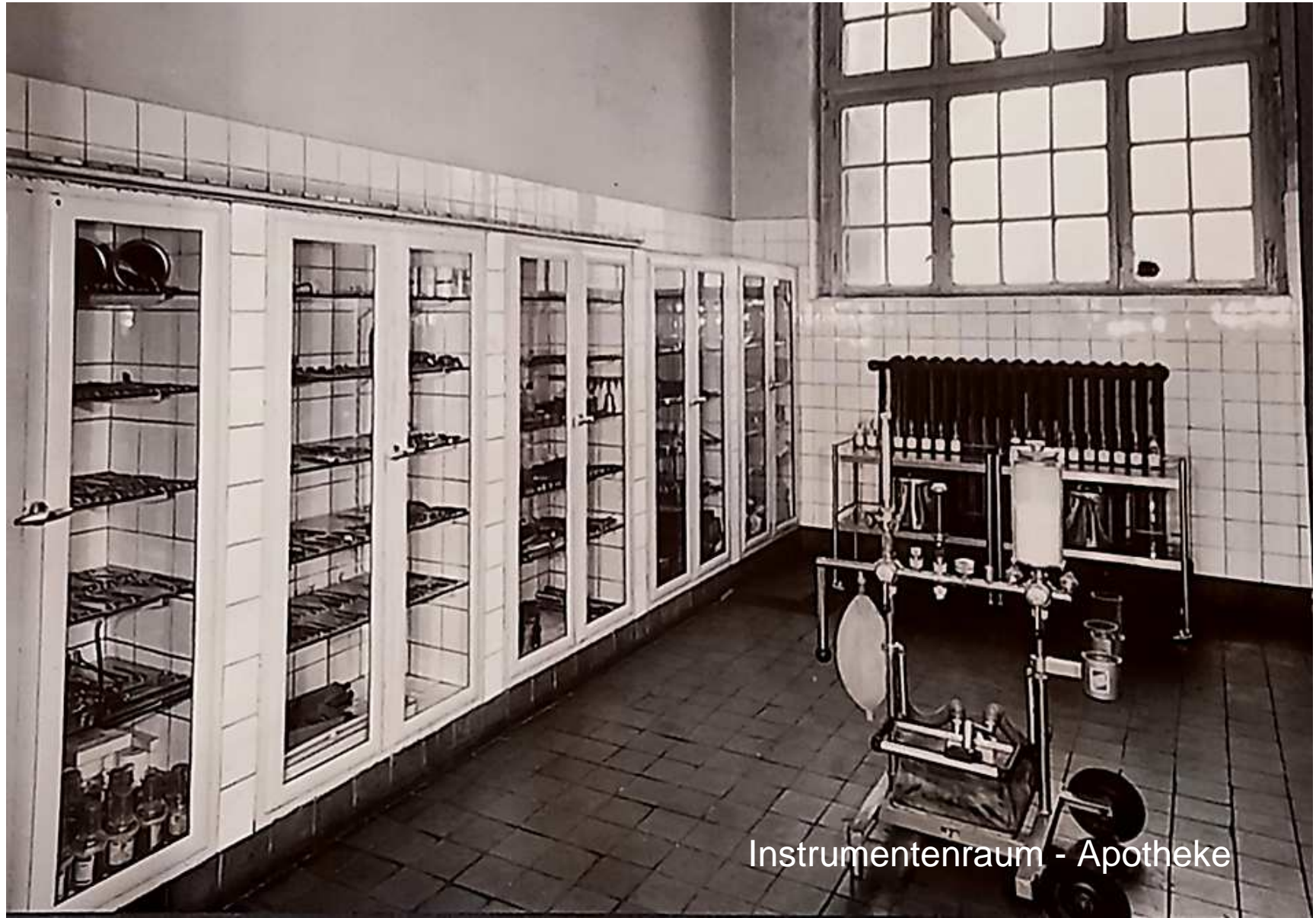
Instrumentenraum - Apotheke