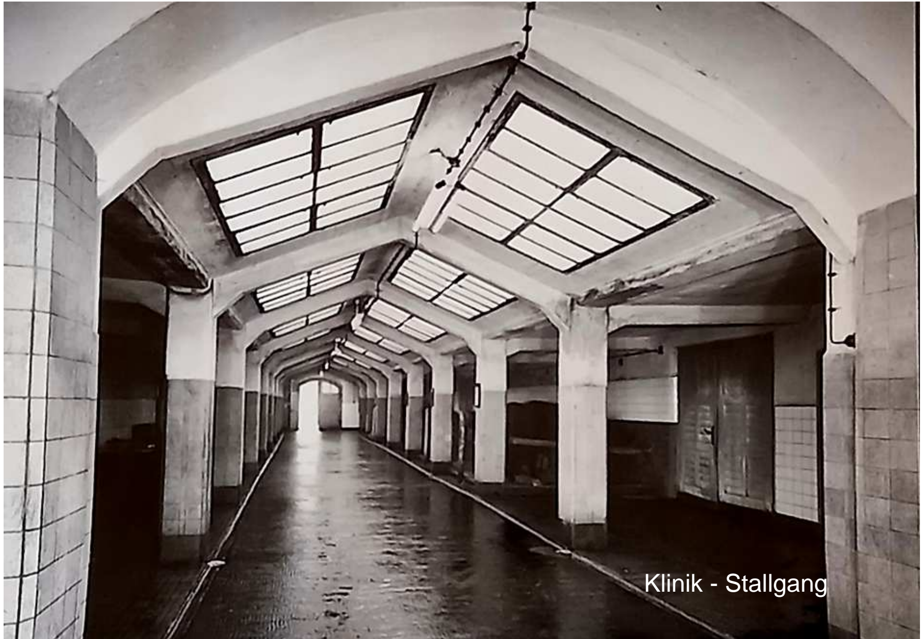
Klinik - Stallgang