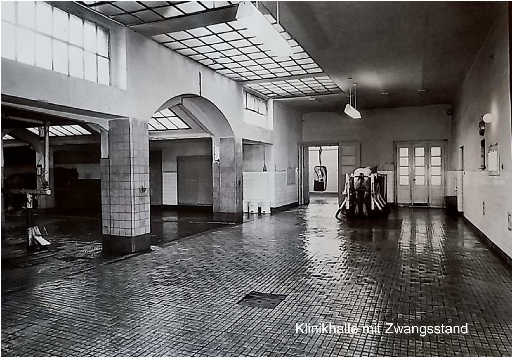
Klinikhalle mit Zwangsstand